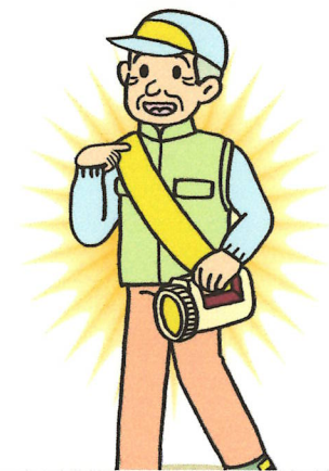
夜間外出は反射材を着用