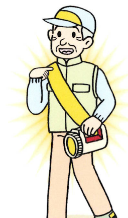
夜間外出は反射材を着用