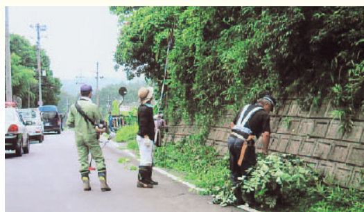
会員による除草作業

毎年8割以上のチームが無事故・無違反を達成しており、交通事故防止に大きく貢献しています。