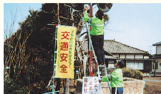
会員によるカーブミラー清掃活動