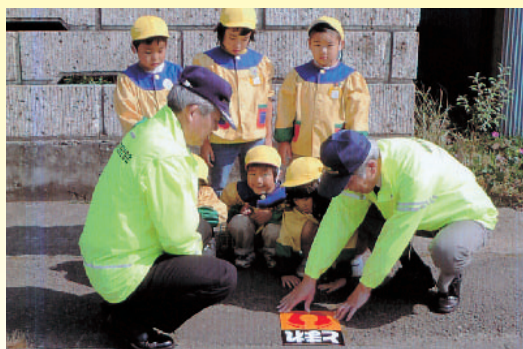
園児とともにストップマークの貼付

表彰は、各地区、県、東北で行うもののほか、全国規模で行う緑十字金（銀、銅）章の制度があります。